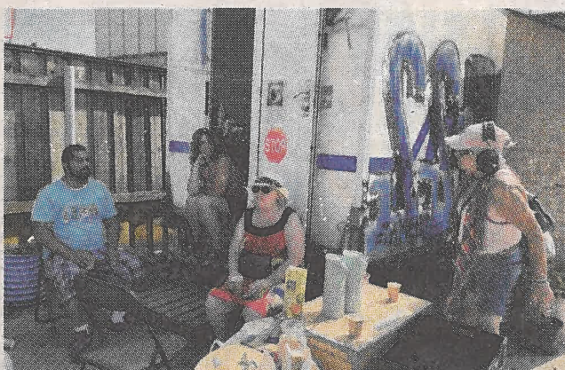
Skraldecaféen har fået nyt køkken i Sydhavnen og vil servere overskudsmad derfra /08