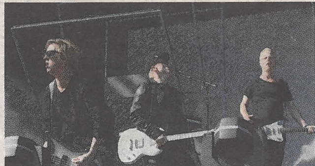
Pop-rock-bandet Carpark North giver koncert til Fed Fredag i Tivoli Friheden.

'Jam Night': spil med eller høre andres improviserede sammenspil. Arr.: Fatter Eskil, Skolegade 25, Aarhus C. Grattis. Kl. 21.30.